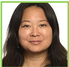
Jessica Polfjärd | EPP, Suecia

Eurodiputada en la pasada legislatura por Ciudadanos (Renew) , se integra ahora en la delegación del PP. Ha trabajado en materias de energía, medioambiente, salud, movilidad y digitalización, y, como suplente en ENVI , ha participado con implicación directa en la tramitación del Reglamento de Envases y Residuos de Envases (PPWR) . Ingeniera industrial con formación en gestión de empresas (MBA), inició en la política como diputada de la Asamblea de Madrid, con especial foco en temas de economía y hacienda. También fue responsable de área de I+D+i en la ejecutiva nacional de Ciudadanos.