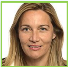
Susana Solís | EPP, España

Además de ser miembro de la Comisión ENVI , durante la última legislatura fue la jefa de la Delegación del PP español en el Parlamento Europeo, cargo que repetirá durante la nueva legislatura. Su actividad se ha centrado en el ámbito de la Salud , aunque implicada también en dosieres como el Reglamento de Envases y Residuos de Envases (PPWR) . Durante los últimos meses de legislatura, se ha mostrado en favor de moderar la ambición verde , oponiéndose a iniciativas como la Ley de Restauración de la Naturaleza. Con experiencia en la política local, regional y nacional, fue diputada y ministra de Sanidad, Servicios Sociales e Igualdad entre 2016 y 2018.