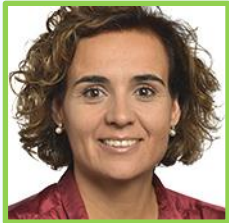
Dolors Montserrat | EPP, España

Médico de formación, Liese es uno de los eurodiputados con mayor experiencia de la cámara (ha participado ininterrumpidamente desde la cuarta hasta la décima legislatura) y será el coordinador de su grupo en ENVI. Como uno de los pesos pesados de la mayor delegación dentro del Partido Popular Europeo, Liese ha sido una de las caras visibles de su grupo en la tramitación de la legislación medioambiental . Así, por ejemplo, durante las últimas semanas ha defendido la necesidad de retrasar la implementación de normativas clave como el Reglamento de la restauración de la naturaleza.