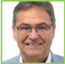
Peter Liese | EPP, Alemania

Médico de formación, Liese es uno de los eurodiputados con mayor experiencia de la cámara (ha participado ininterrumpidamente desde la cuarta hasta la décima legislatura) y será el coordinador de su grupo en ENVI. Como uno de los pesos pesados de la mayor delegación dentro del Partido Popular Europeo, Liese ha sido una de las caras visibles de su grupo en la tramitación de la legislación medioambiental . Así, por ejemplo, durante las últimas semanas ha defendido la necesidad de retrasar la implementación de normativas clave como el Reglamento de la restauración de la naturaleza.