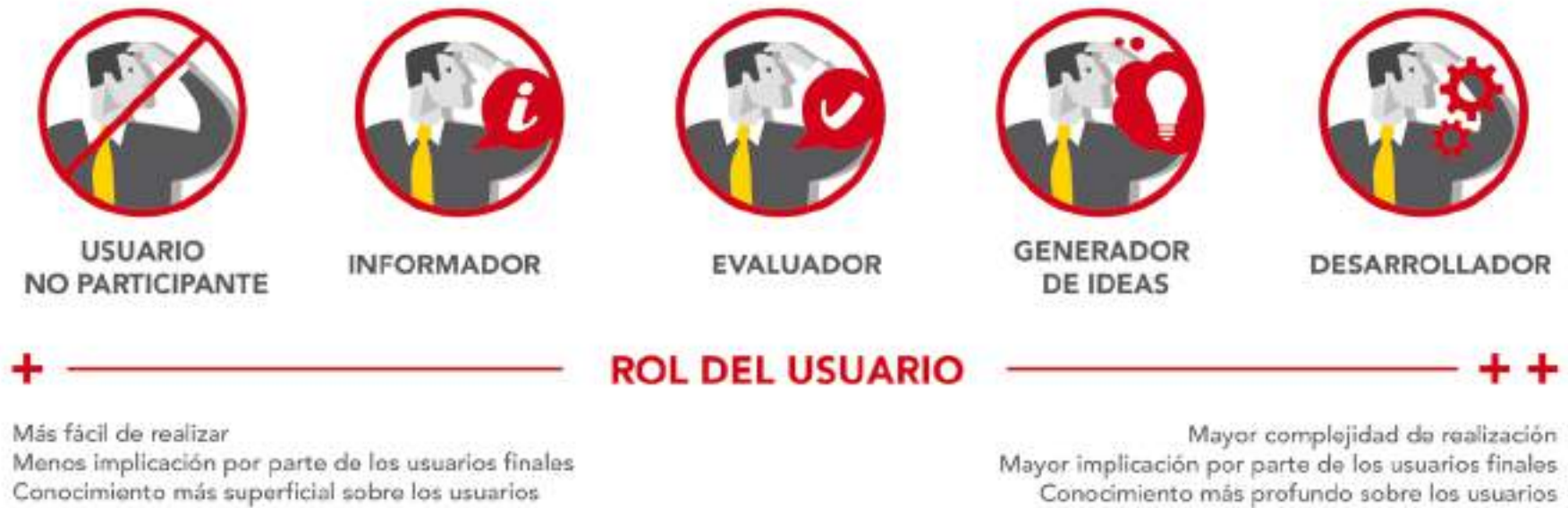
Figura 2: Esquema de los niveles de participación de los usuarios.