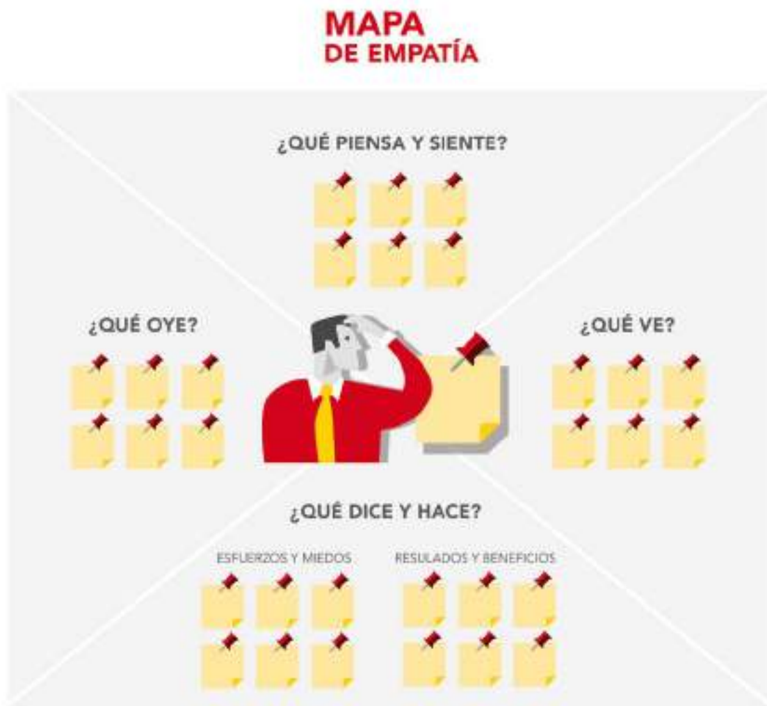
Figura 13: Ejemplo de Mapa de empatía.

Las notas autoadhesivas se utilizarán para incluir en cada cuadrante las respuestas a las preguntas planteadas.