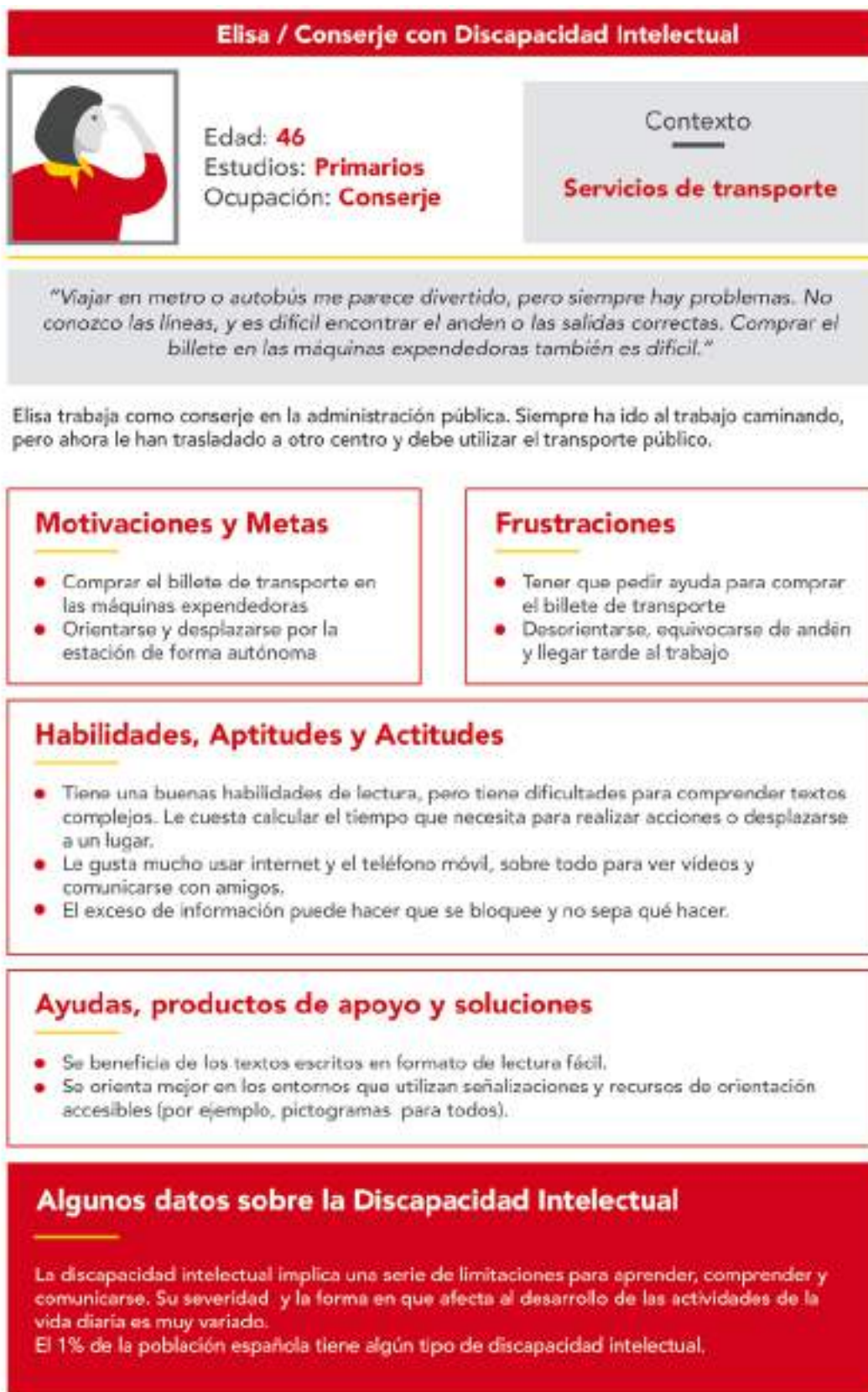
Figura 9: Ficha de ejemplo de una persona con discapacidad intelectual