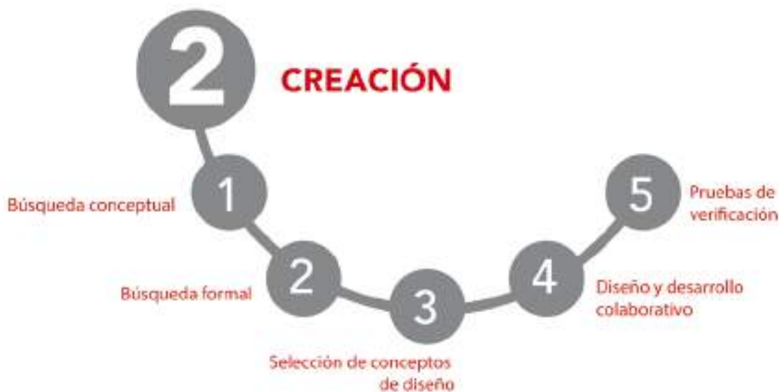
Figura 16: Esquema de las etapas de la fase de Creación.