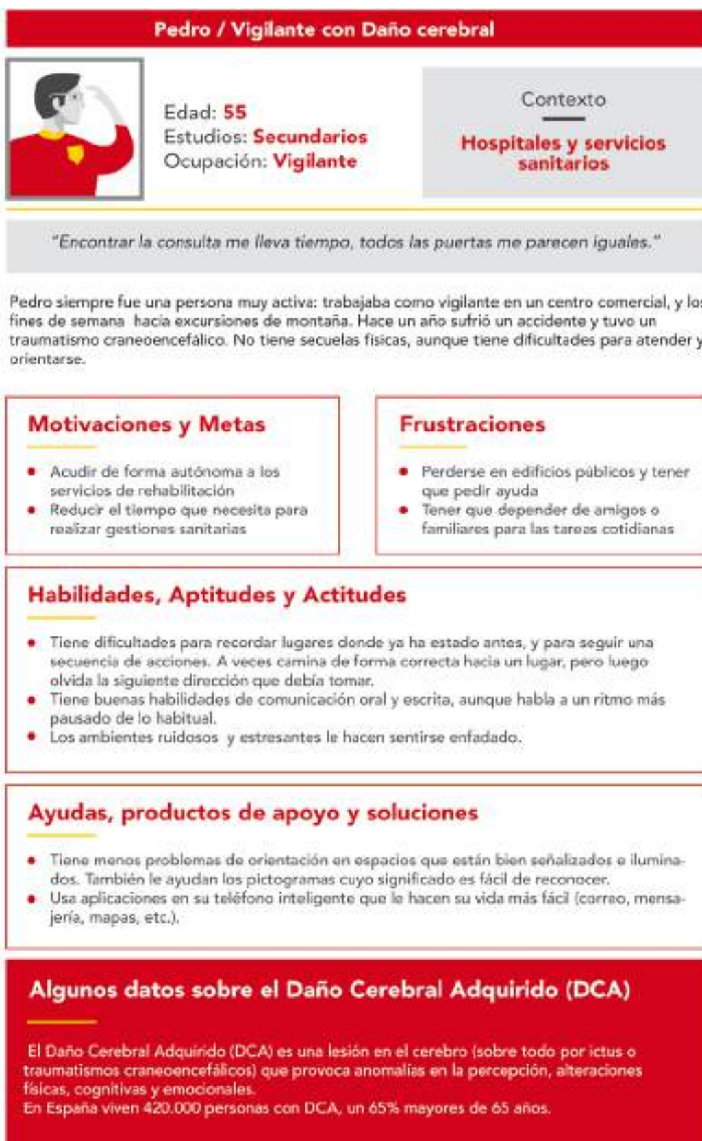
Figura 10: Ficha de ejemplo de una persona con daño cerebral adquirido