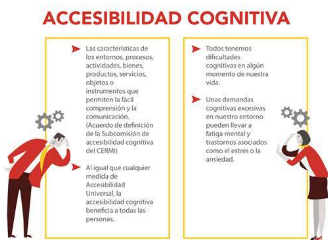
Figura 4: Infografía sobre Accesibilidad cognitiva y sus beneficiarios.

Las infografías son una forma rápida y visual de comunicar datos sobre una determinada población. En este caso, las infografías que se muestran a continuación, permiten comprender el impacto que un diseño inclusivo con las capacidades cognitivas diferentes puede tener en el número de usuarios potenciales.