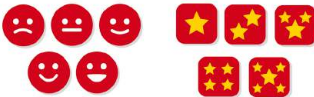
Figura 18: Ejemplo de ítems para votación.