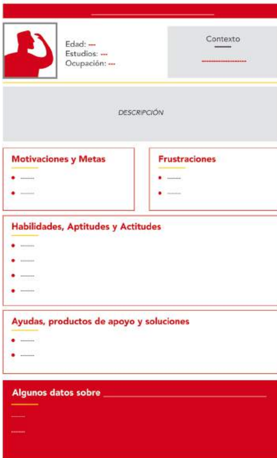
Figura 12: Plantilla para crear una ficha de persona

Usando la siguiente plantilla, pueden crearse personas adicionales basándose en la experiencia de asociaciones e investigación sobre perfiles de usuario concretos: