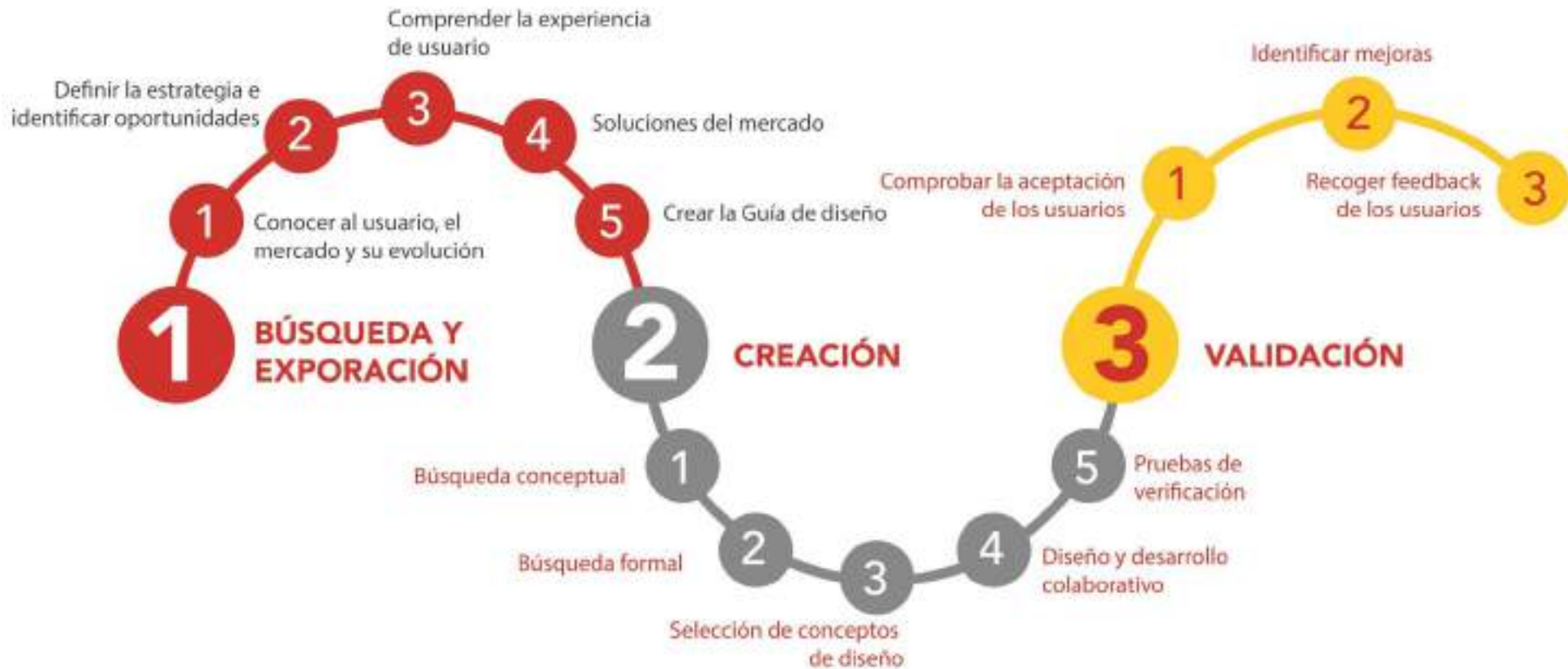
Figura 1: Esquema de la metodología de Diseño para todos considerando las capacidades cognitivas.