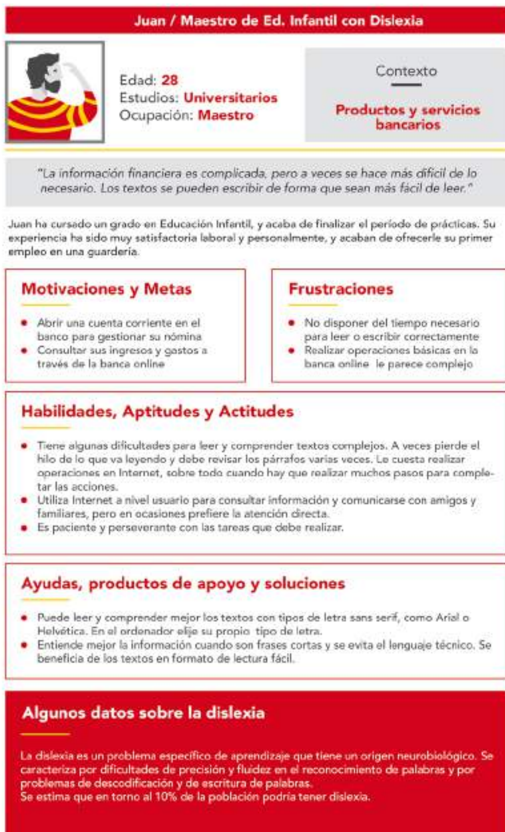
Figura 8: Ficha de ejemplo de una persona con dislexia