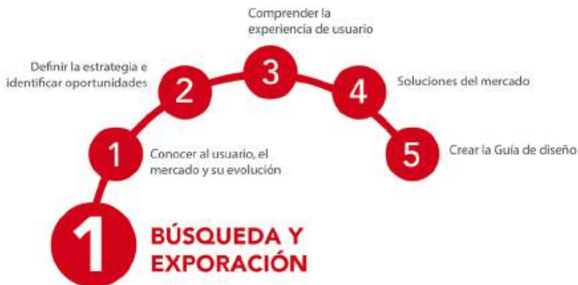
Figura 3: Esquema de las etapas de la fase de búsqueda y exploración.