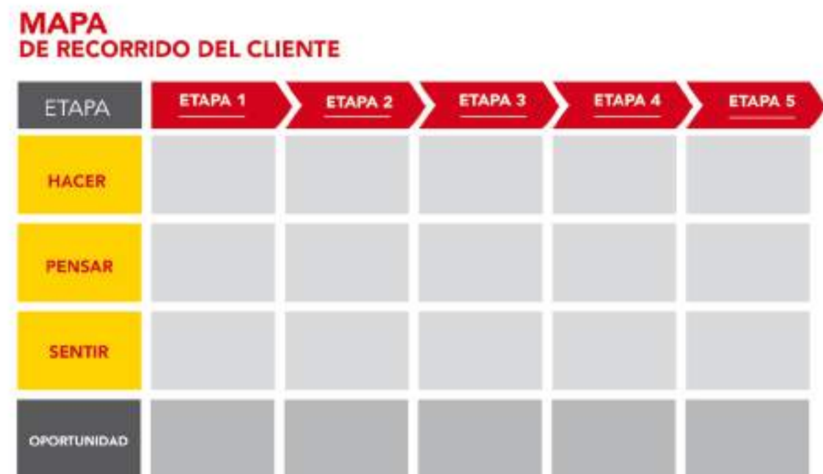
Figura 17: Ejemplo de mapa de recorrido del cliente.

A continuación se muestra una plantilla que puede servir de ejemplo para crear el mapa de experiencia de cliente: