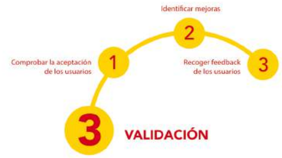
Figura 19: Esquema de las etapas de la fase de Validación.